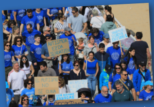
2024ean Donostian ospatutako ibilaldiaren irudia.

Durante la marcha nos acompañará la comparsa de gigantes y cabezudos de Tolosa.